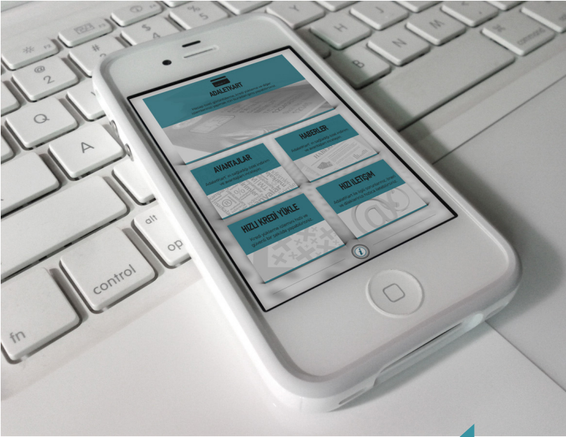
AdaletKart Mobil Uygulaması